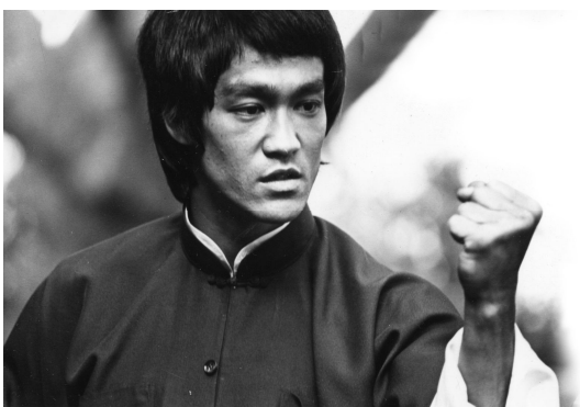
บรูซ ลี (Bruce Lee)

ความแม่นยำจึงค่อนข้างสูง ซึ่งต้องแลกมาด้วย การขาดทุนเฉลี่ยที่ สูงตามไปด้วย